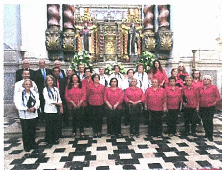
Actuação grupo coral