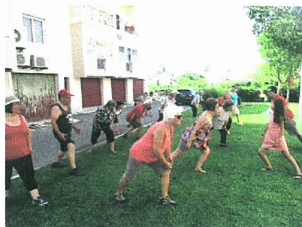
Aula de ginástica na comunidade