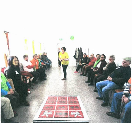
Jogo do Burro