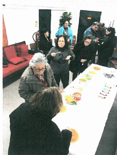
Concurso de Sopas