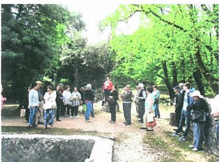
Passeio Real Fábrica do Gelo